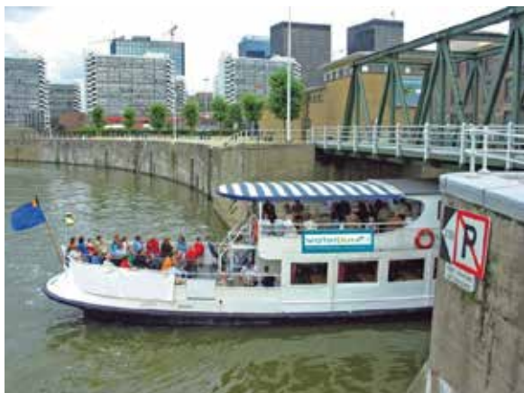
Waterbus – Brussel - Redersbrug

De Waterbus is een openbare, klokvast en filevrije lijndienst OP het Zeekanaal die toelaat je op een comfortabele en duurzame wijze te verplaatsen in de kanaalzone, tussen Brussel en Vilvoorde, nu gekenmerkt door grote mobiliteitsproblemen, die in de toekomst nog groter dreigen te worden. Het is een multifunctioneel en attractief vervoermiddel gericht op winkelen, recreatie, toerisme, woonwerkverkeer. Wie wenst kan aan boord ontbijten, de krant lezen, vergaderen of gewoon genieten. De haltes van deze 'bootbus' liggen nabij knooppunten van tram, bus, metro en trein. De fiets kan steeds mee aan boord van de Waterbus.