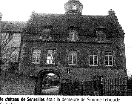
Le château de Senzeilles était la demeure de Simone Lehouck-Gerbehaye.

Le parcours de Simone Lehouck en politique sera très rapide. Élie au conseil communal de Senzeilles le 24 novembre 1946, elle devient échevine en janvier 1947 et puis bourgmestre de mai 1947 jusqu'à la fusion des communes. Au niveau local, l'un des moments forts de sa carrière politique fut l'inauguration, en 1951, de l'école restaurée des filles en présence du Ministre de l'Instruction publique Harmel. le 24 avril 1953, une plaque a été placée à l'entrée du château en hommage à Simone Lehouck. pris position contre l'amnistie des collaborateurs », se souvient Jean-Marie Maillet. « Les Flamands se sont donc vexés et lui ont fait perdre son poste de sénatrice. Elle a été exécuté. Elle est ensuite passée au Rassemblement wallon mais elle n'a rien obtenu au niveau de ce parti ». V.P.