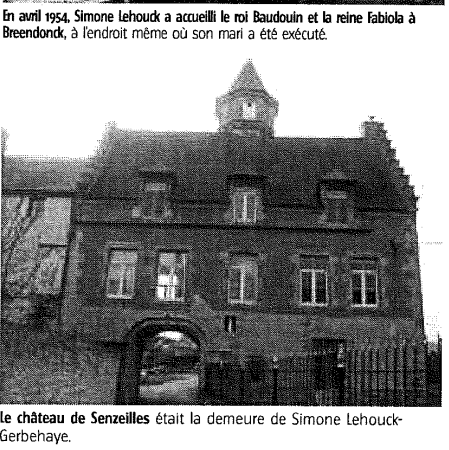
Le château de Senzeilles était la demeure de Simone Lehouck-Gerbehaye.

Le parcours de Simone Lehouck en politique sera très rapide. Élue au conseil communal de Senzeilles le 24 novembre 1946, elle devient échevine en janvier 1947 et puis bourgmestre de mai 1947 jusqu'à la fusion des communes. Au niveau local, l'un des moments forts de sa carrière politique fut l'inauguration, en 1951, de l'école restaurée des filles en présence du Ministre de l'Instruction publique Harmel. le 24 avril 1953, une plaque a été placée à l'entrée du château en hommage à Simone Lehouck. près sa position contre l'amnistie des collaborateurs, se souvient Jean-Marie Maïter. Les Flamands se sont donc vexés et lui ont fait perdre son poste de sénatrice. Elle est ensuite devenue la première femme sénatrice en 1949.